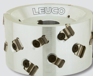
LEUCO DP SmartJointer: Die Geräuschreduzierung von bis zu 3 dB sorgt für ein angenehmeres Arbeiten.