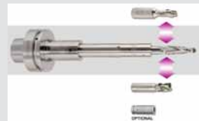
Flexibler Einsatz von Schaftfräsern mit der TRIBOS-Verlängerung