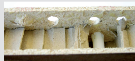
результаты сверления в сравнении с лева: стандартное сверло с права: LEUCO VHW сверло из твёрдого сплава для глухих отверстий