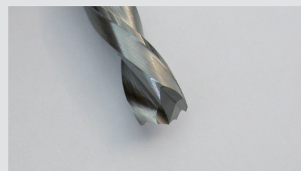
LEUCO VHW сверло