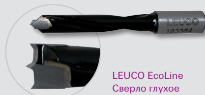
LEUCO EcoLine Сверло глухое