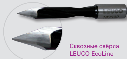
Сквозные свёрла LEUCO EcoLine