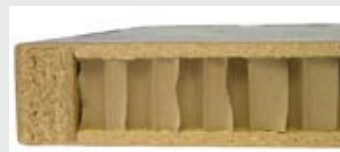
Поперечный срез плиты EGGER EUROLIGHT®