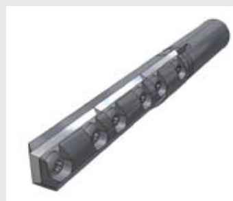
LEUCO Концевая фреза со сменными ножами для угловых соединений